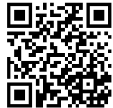
“Passing on the Torch” website

3. The EDB and the GBA Office of the CMAB will launch the Kick-off Ceremony cum Briefing Session (the Ceremony) on 14 October 2024 (Monday) to promote and let interested students learn more about the details of the Competition. The Ceremony also features a thematic seminar to introduce the latest development of the GBA. All students and teacher advisors intending to participate in the Competition are encouraged to attend the Ceremony. Interested schools are requested to download the Enrolment Form ( Annex 2 ; Chinese version only) from the “Passing on the Torch” website ( https://www.passontorch.org.hk/en/index.html ) and email the completed form to the Life-wide Learning and Mainland Exchange Section 2 of the EDB (thematicmep2@edb.gov.hk) at or before 5 p.m. on 2 October 2024 (Wednesday) .