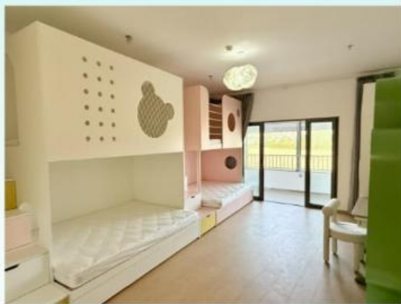
二楼4人间绿野仙踪主题房: